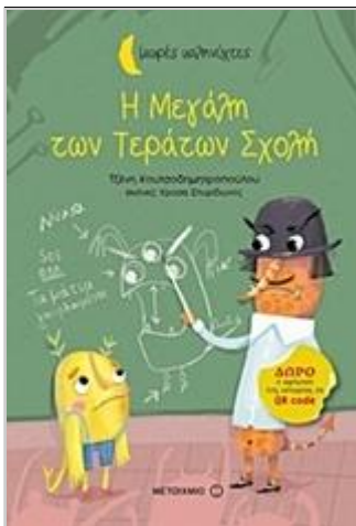
Γλωσσικό υλικό Μονογραφικό έργο