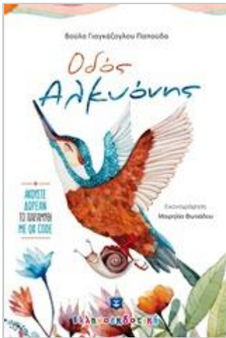
Γλωσσικό υλικό Μονογραφικό έργο

Η βιβλιοθήκη του σχολείου ανέπτυξε μια συλλογή πολυμεσικών βιβλίων, για δανεισμό. Η συλλογή απευθύνεται σε μικρούς μαθητές-γονείς και αποτελείται από βιβλία με αφήγηση (μέσω τεχνολογίας QR code σε κινητό) και βιβλία επαυξημένης πραγματικότητας (εφαρμογή σε κινητό). Στόχος είναι, η συλλογή να λειτουργήσει ως υποστηρικτική υπηρεσία, που διευκολύνει την μαθησιακή διαδικασία με την χρήση νέων τεχνολογιών.